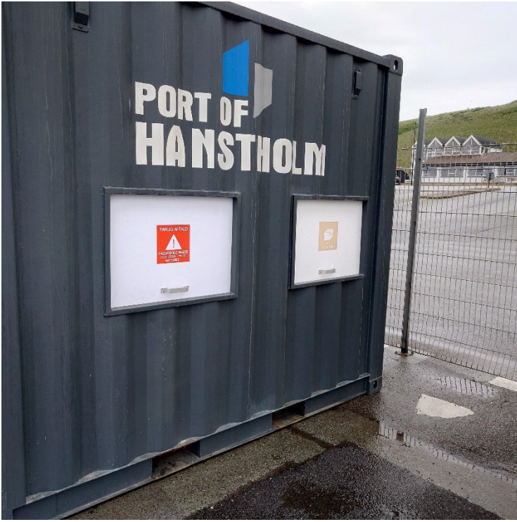
Beholder til affaldssortering