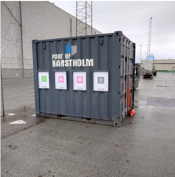
Beholder til affaldssortering