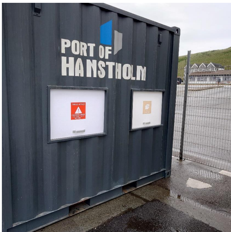
Beholder til affaldssortering