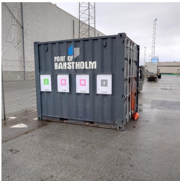
Beholder til affaldssortering