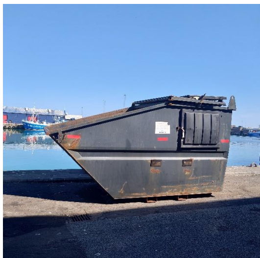
Stor beholder til dagrenovation. Kan bestilles.